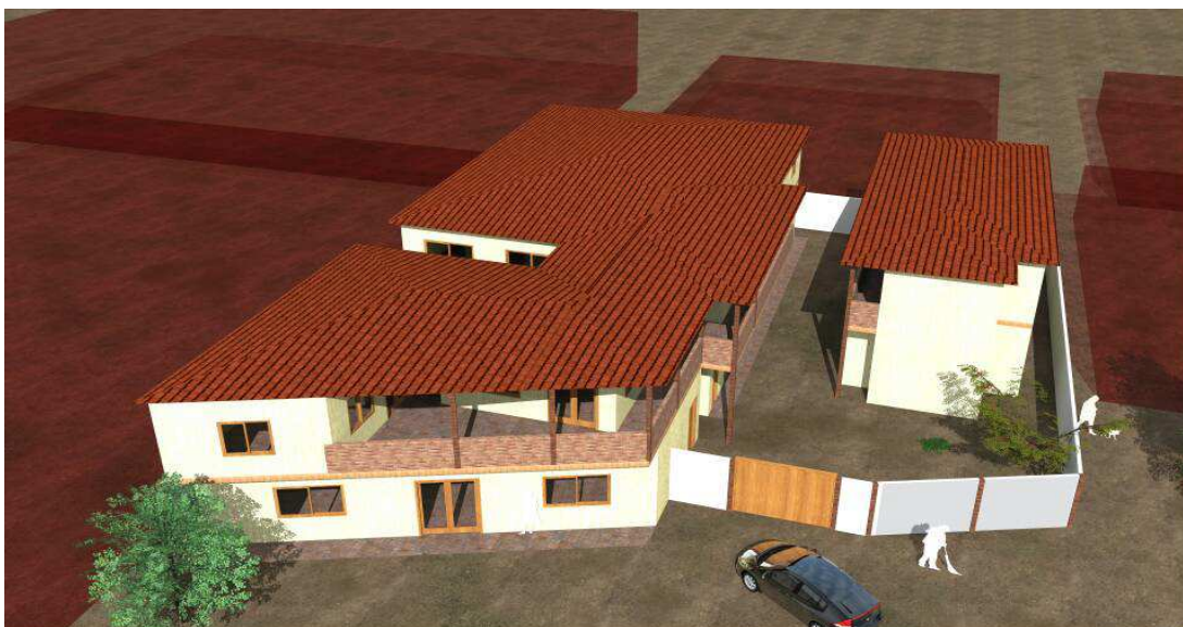
Figure 1 : plan représentatif du centre

Wir planen Seminare, Workshops und Abendkurse speziell für Menschen in Verantwortung und Leitung durchzuführen. Es werden auch verschiedene Ressourcen zum Familienleben zur Verfügung stehen, darunter eine Buchhandlung, eine Bibliothek, ein Kinderspielplatz und thematische Aktivitäten für alle Altersgruppen. Dieser Ort soll ein einladender Ort für Familien aus allen Lebensbereichen sein.