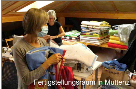
Fertigungsraum in Muttenz