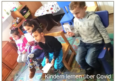
Kindern lernen über Covid

BoL bietet Sprach- und Leseförderung für Roma-Kinder und Erwachsene, Unterstützung der Kinder in der Schule, Pflege der Elternkontakte und Fürsprache für die Roma in der serbischen Gesellschaft an. Durch Corona ist die Arbeit in allen Orten momentan sehr eingeschränkt.