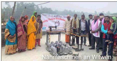
Nähmaschinen an Witwen

Living Water Nepal (LWN) strebt eine partnerschaftliche Zusammenarbeit mit lokalen Gemeinden und Leitern an, um Einzelne und Gemeinschaften durch ganzheitliche Entwicklung zu verändern. Es gibt daher Quellwasserprojekte, Gesundheitsprogramme und andere Projekte zur Gemeindeentwicklung, je nach Bedarf der Gemeinden. Durch Covid-19 ist auch Nepal sehr betroffen. Viele Menschen verloren ihre Arbeit und Unternehmen brachen zusammen. Daher setzte LWN Mittel ein, um ausgegrenzte und sozial benachteiligte Menschen zu unterstützen. Schulsäcke wurden an Schülern verteilt und somit Familien entlastet, die solche Materialkosten nicht mehr tragen konnten. Kinder konnten dadurch weiter zur Schule gehen. Die positive Botschaft hat sich im ganzen Dorf verbreitet, dass man Hilfe bekommt, wenn man in die Schule geht. Das ist wirklich eine Ermutigung für die Schüler und auch für die Eltern, ihre Kinder in die Schule zu schicken.