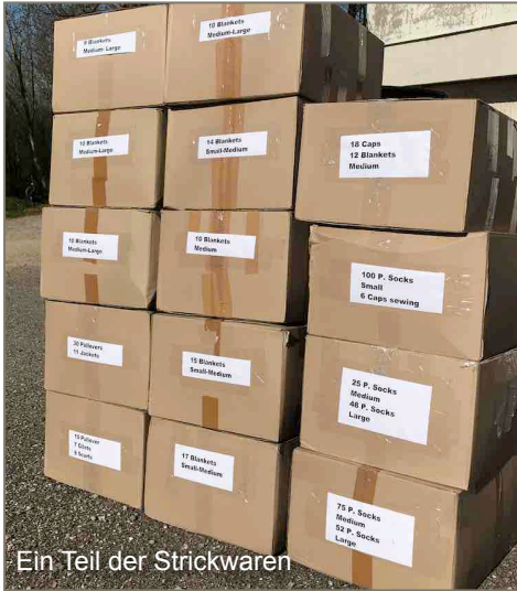
Ein Teil der Strickwaren

empfangen kann, ist das Stricken eine gute Abwechslung. Es verkürzt ihre Tage, gibt ihr Tagesstruktur und Sinn, sie kann etwas machen, was gebraucht und geschätzt wird. Es bedeutet für sie Lebensqualität, noch etwas zum Leben von anderen Menschen beitragen zu können. Beim Stricken denkt sie sich aus, wer dies wohl tragen wird und hofft, dass es diese Person erfreuen und wärmen wird an Leib und Seele - eine Win-Win Situation im wahrsten Sinn des Wortes! Bei vielen Strickenden tönt es ähnlich.