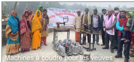
Machines à coudre pour les veuves

"Living Water Nepal" (LWN) a pour objectif de travailler en partenariat avec les communautés et les responsables locaux afin de transformer la vie des personnes et des communautés grâce à un développement holistique. Il existe donc des projets d'eau de source, des programmes de santé et d'autres projets de développement communautaire selon les besoins des communautés. Le Népal est également fortement touché par la pandémie. De nombreuses personnes ont perdu leur emploi et des entreprises se sont effondrées. Par conséquent, LWN a utilisé des fonds pour soutenir des personnes marginalisées et socialement défavorisées. Des cartables furent distribués aux élèves, soulageant ainsi les familles qui ne pouvaient plus assumer de tels coûts. Les enfants ont ainsi pu continuer à suivre l'école. Le message positif s'est répandu dans tout le village : si vous allez à l'école, vous obtiendrez de l'aide. C'est un véritable encouragement pour les élèves, et pour les