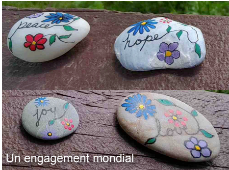
Un engagement mondial

Durant la pandémie, le Mennonite Central Committee (MCC) a étendu son travail en réponse à la crise mondiale , en renforçant les projets dans les domaines de l'eau, de l'assainissement et de l'hygiène (WASH), des initiatives de santé locales et de l'aide alimentaire. Ils sont reconnaissants de la réponse positive des supporters et des donateurs pour ce travail. Vous trouverez ci-dessous quelques exemples du travail du MCC dans ce domaine prioritaire à travers le monde .