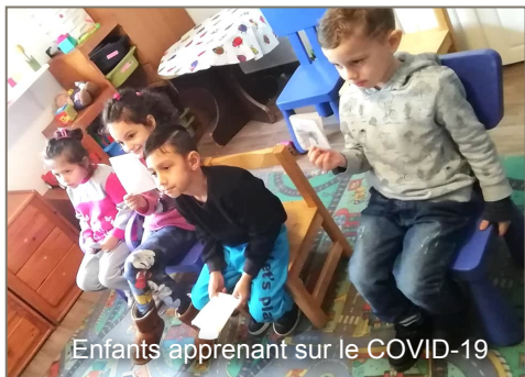
Enfants apprenant sur le COVID-19

BoL offre un soutien linguistique et de lecture aux enfants et adultes Roms, un soutien aux enfants à l'école, le maintien des contacts parentaux et la défense des Roms dans la société serbe. En raison du COVID-19, le travail dans les trois lieux est actuellement très réduit.