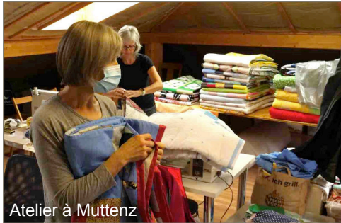
Atelier à Muttenz