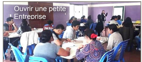
Ouvrir une petite Entreprise

En Bolivie, il existe un système scolaire qui vise l'enseignement universitaire après la maturité. Cependant, de nombreux jeunes ne parviennent pas à entrer à l'université et travaillent ensuite comme ouvriers, travailleurs occasionnels ou chauffeurs de taxi, par exemple. Dans un centre, divers cours de formation aux métiers de l'artisanat sont désormais proposés pour aider les jeunes à obtenir une formation pratique. Grâce à un fonds de formation assorti de conditions-cadres claires, les jeunes bénéficient d'un soutien. Ainsi, par exemple, une jeune femme a pu terminer sa formation d'infirmière.